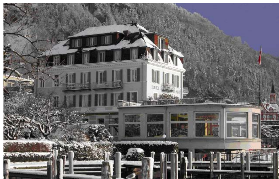
im Hobby Hotel Terrasse in Vitznau

vom 27. Dezember 2011 bis 1. Januar 2012